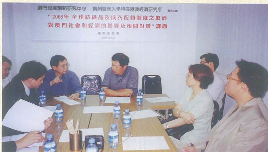
諮詢座談是本中心開展課題研究的其中一項重要活動。