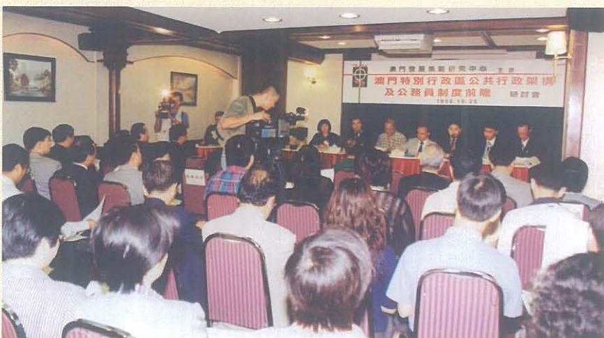
“澳門特別行政區公共行政架構及公務員制度前瞻”研討會於1998年10月25日舉行，港澳專家、學者共同獻計獻策。