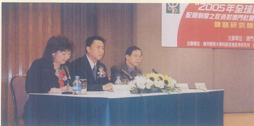
經過廣泛諮詢和深入研究工作，“2005年全珠紡織品及成衣配額制度之取消對澳門社會與經濟的影響及其對策”課題研究報告於2001年10月31日公佈。