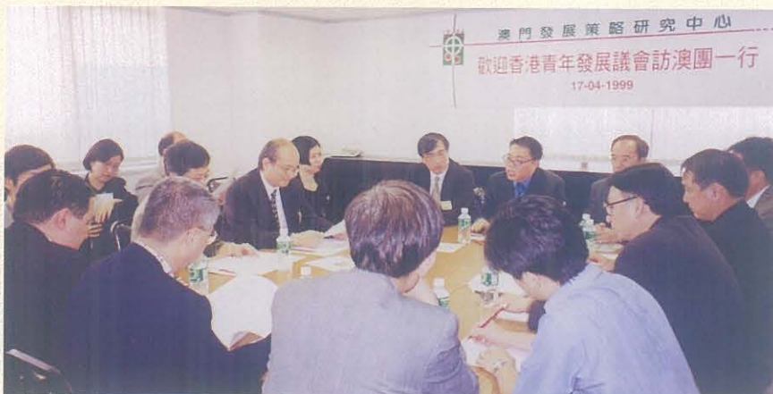
香港青年發展議會訪澳團在1999年4月17日來澳考察，與本中心成員就港澳兩地問題交換意見。