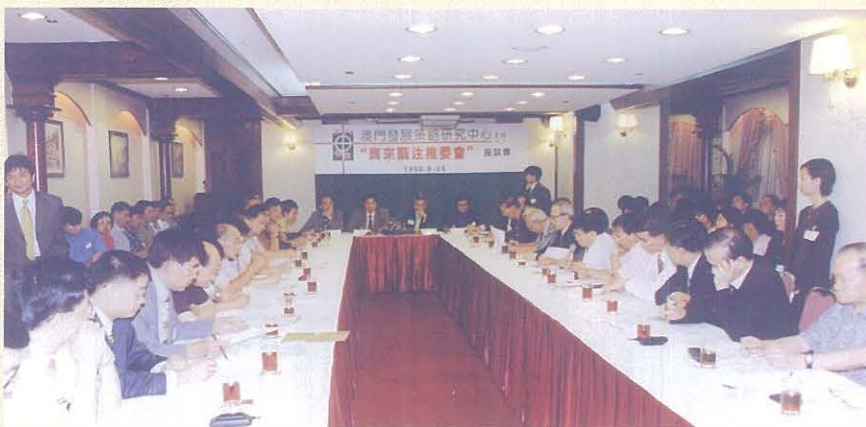
1998年8月25日“齊來關注推委會”座談會舉行，社會各界紛紛就推委會的籌組發表意見。