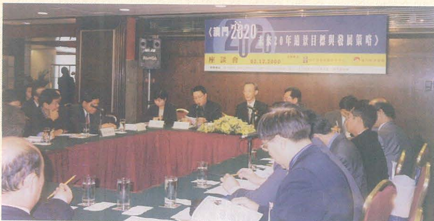
本中心與澳門經濟學會於2000年聯合進行《澳門2020——未來20年遠景目標與發展策略》課題研究。