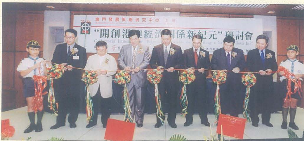
1999年6月27日舉行之“開創港澳經濟關係新紀元”研討會受到社會關注，多位港澳知名人士應邀出席主禮。