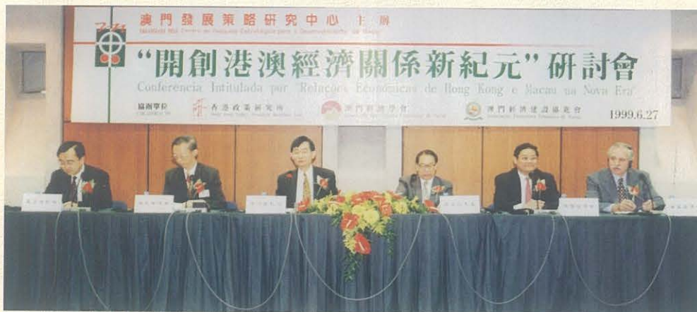
“開創港澳經濟關係新紀元”研討會邀請到港澳及內地知名人士、學者、專家出席，共同探討港澳經濟關係的未來發展方向。