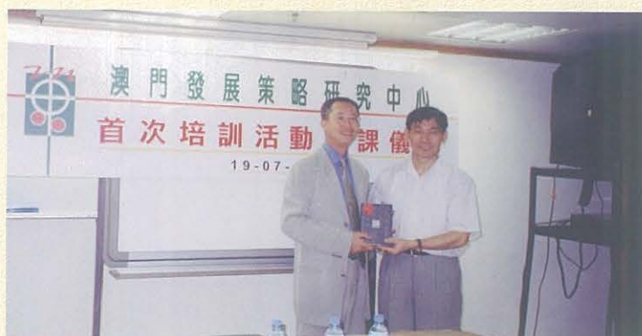
為了貫徹自強不息的理念，本中心於2001年7月份舉辦了首次內部培訓活動，藉此提升中心成員的素質。