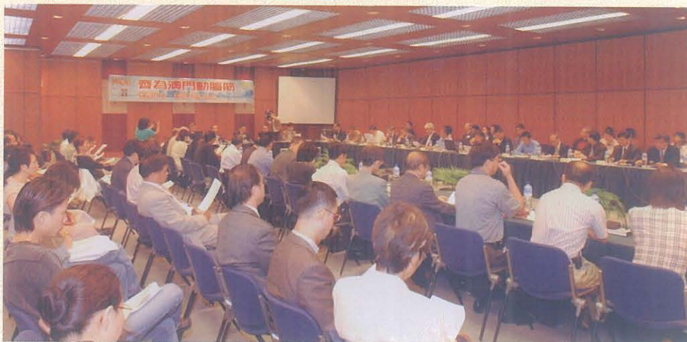
“齊為澳門動腦筋——因應定位、自強不息”座談會於2002年5月26日舉行，得到了社會各界的積極回應，多個社團大力協辦，300多人次出席座談，40多位人士發表講話。