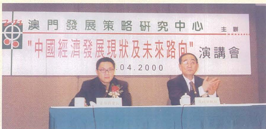
2000年4月8日，我國著名經濟學家厲以寧教授應本中心邀請來澳擔任“中國經濟發展現狀及未來路向”演講會主講嘉賓。