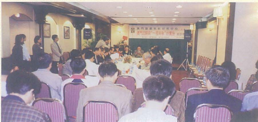
回歸前夕，本中心舉行“澳門回歸與‘一國兩制’的實施”座談會。