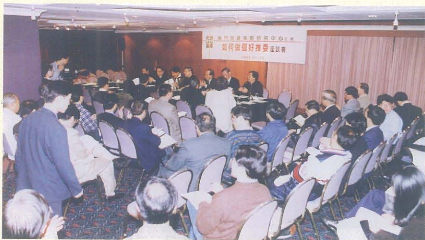
“如何做個好推委”座談會於1999年1月25日舉行，社會各界人士對推選委員提出了殷切的期望。