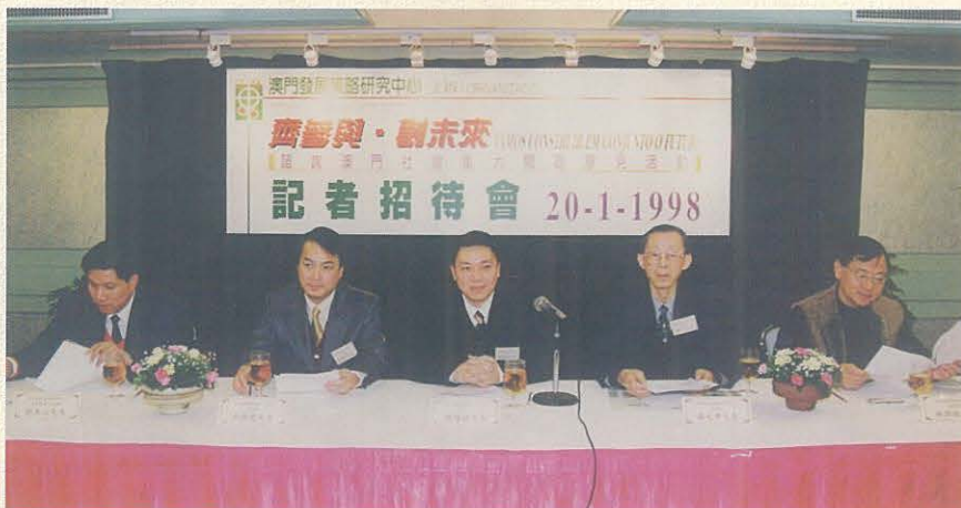
本中心於1998年1月20日舉行成立後首項大型諮詢活動：“齊參與·創未來”——諮詢澳門社會重大問題意見活動。