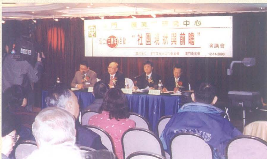
2000年11月12日，本中心舉行“社團現狀與前瞻”演講會，港澳兩地人士交流社團工作經驗。