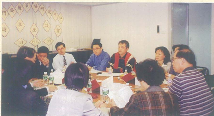
內部座談會是本中心其中一項常設活動，除了本中心成員外，本中心還會邀請部份社會人士參與座談，以深化對相關社會問題的研討。