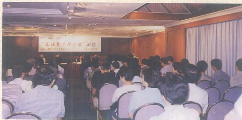
2001年5月24日，本中心舉辦了“立法會選舉前瞻”論壇，藉此推動澳門社會各界共同關注健康選舉文化的建立。